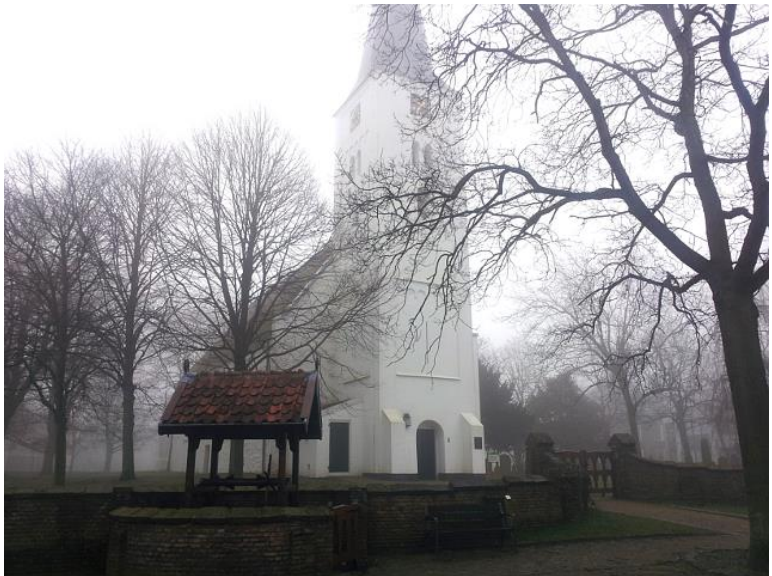
Een Willibrordusput in Heiloo